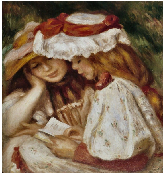
Auguste Renoir, Jeunes lectrices