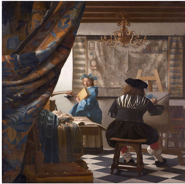
Jan Vermeer, L'atelier du peintre