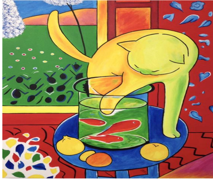
Henri Matisse, Le chat avec poisson rouge