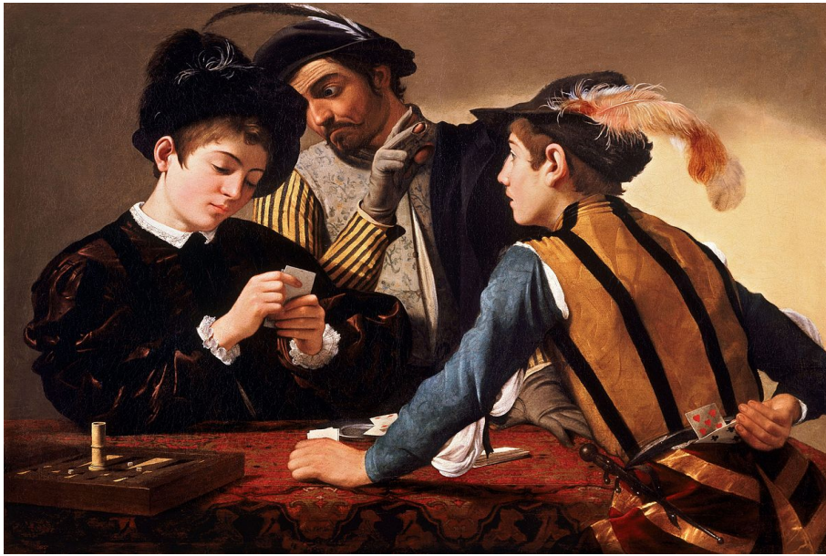
Le Caravage, Les tricheurs