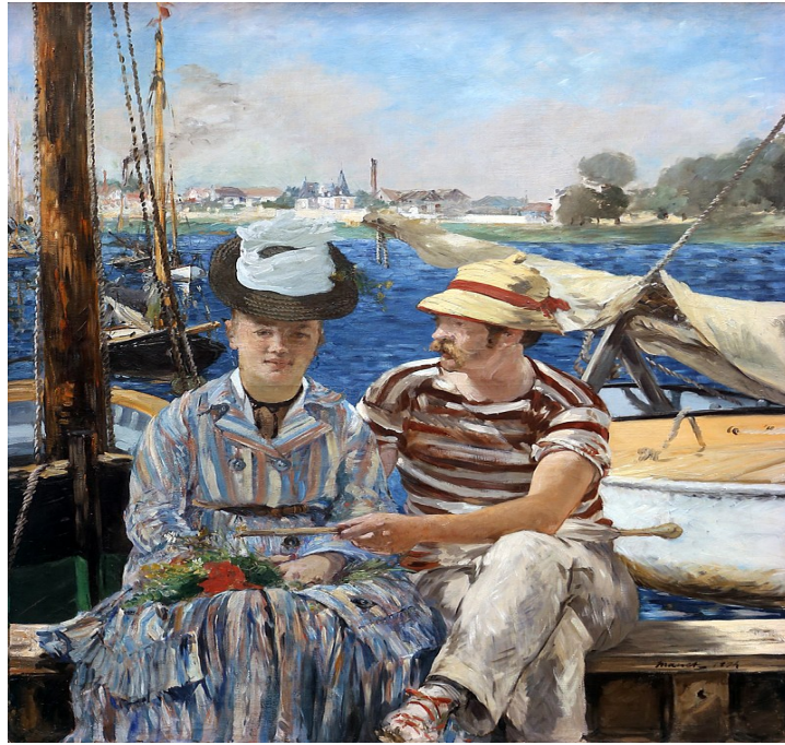
Edouard Manet, Argenteuil