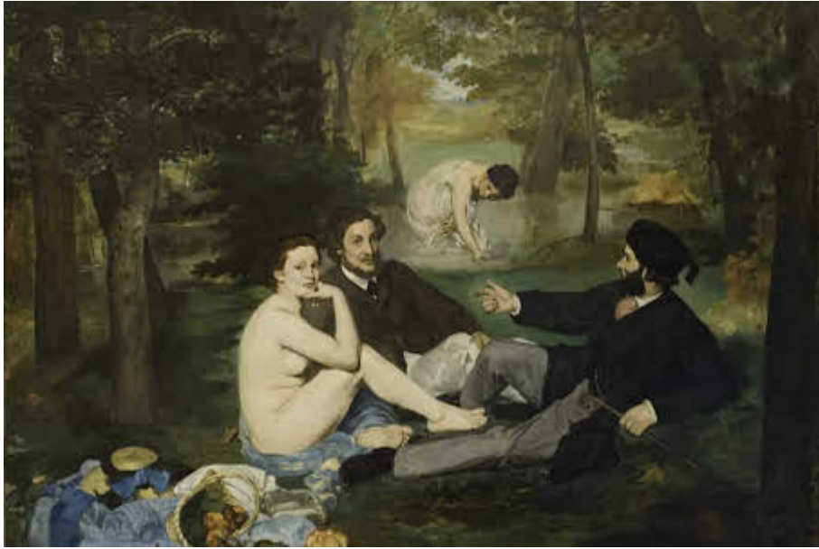
Edouard Manet, Le déjeuner sur l'herbe