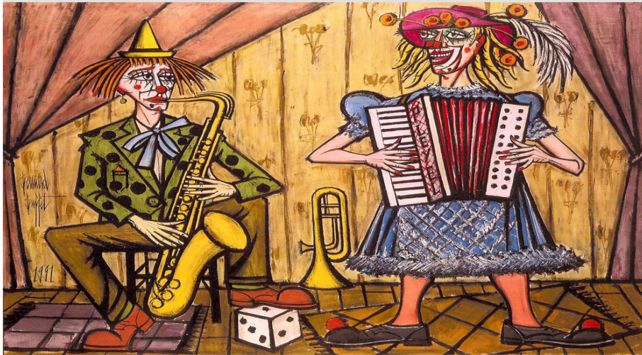
Bernard Buffet, Les clowns musiciens