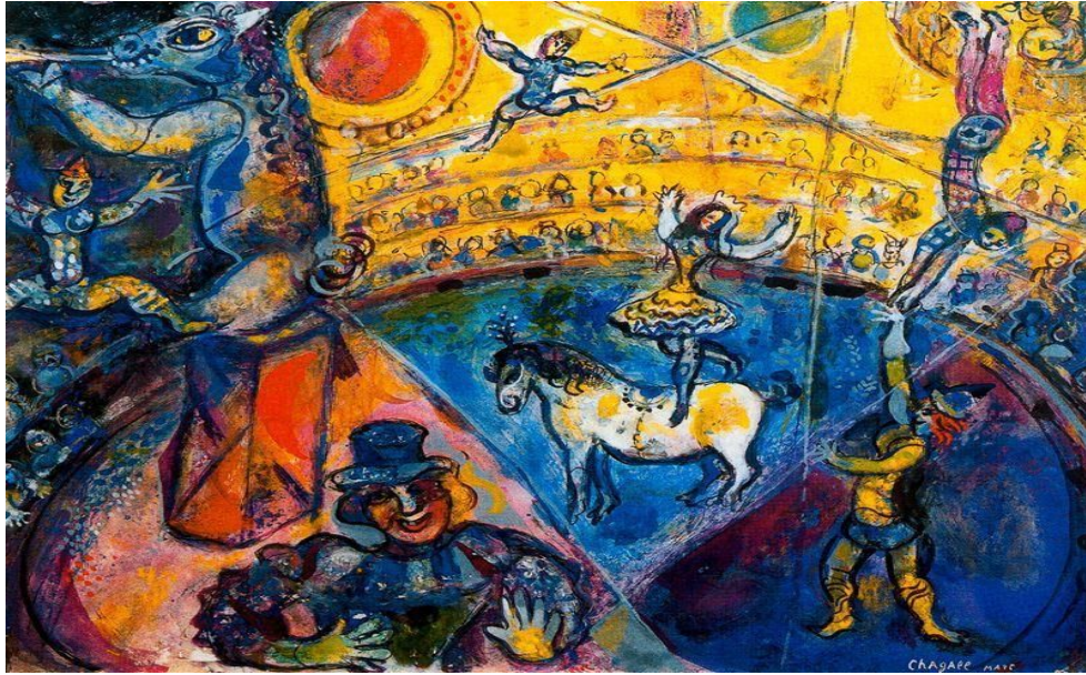
Marc Chagall, Le cirque