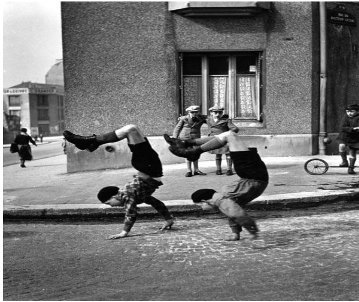
Robert Doisneau, La course en poirier